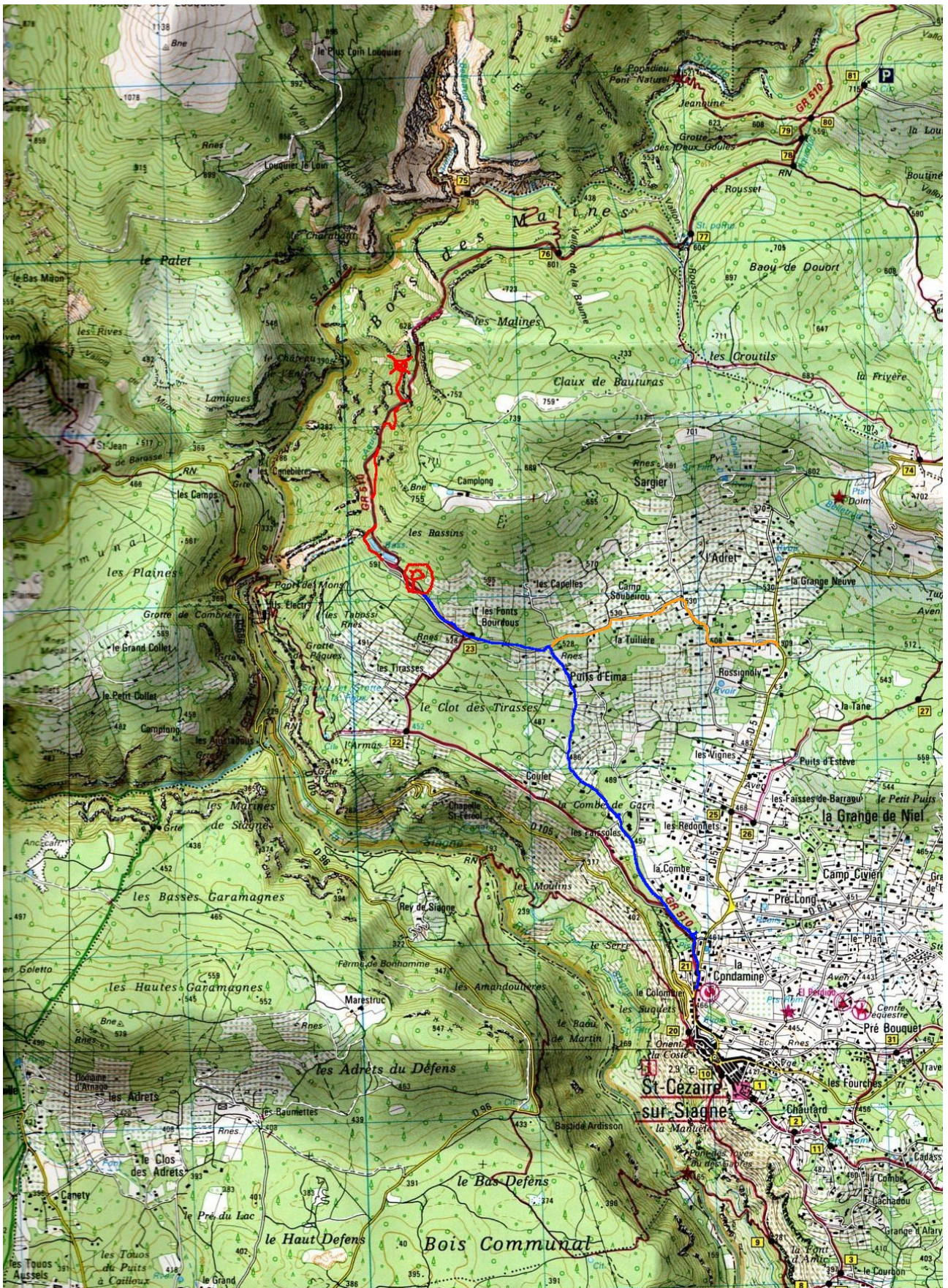
Plan d'accès à la falaise. En bleu: la route. En orange: une variante de la route (chemin des bassins). P rouge: parking. En rouge: le chemin qui suit plus ou moins le GR violet faux de la carte IGN. X rouge: la falaise.